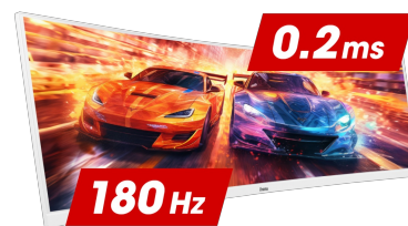
180Hz & 0.2ms MPRT

De Fast IPS-paneeltechnologie garandeert niet alleen betrouwbaarheid, levendige slagveldscènes die worden weergegeven met een voortreffelijke kleurnauwkeurigheid, maar biedt ook een uitstekende Moving Picture Response Time (MPRT) van 0.2ms.